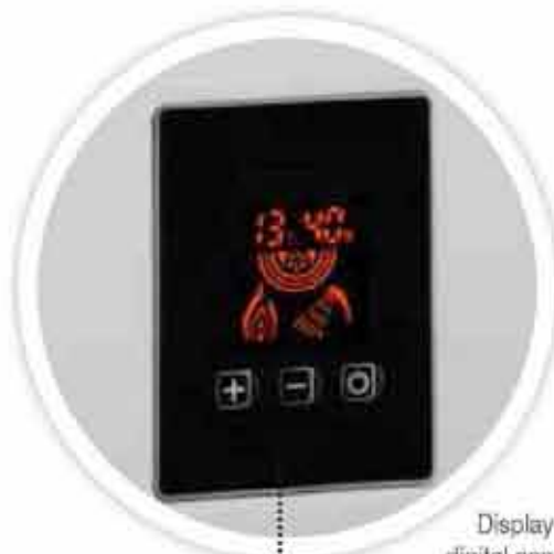
Display digital con selector de temperatura