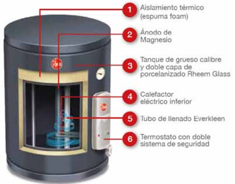
Ilustración genérica, solo para referencia.