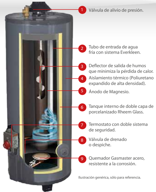
Ilustración genérica, sólo para referencia.